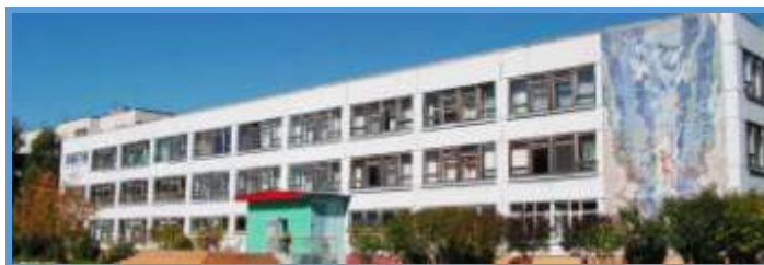
МБОУ «СОШ № 83»