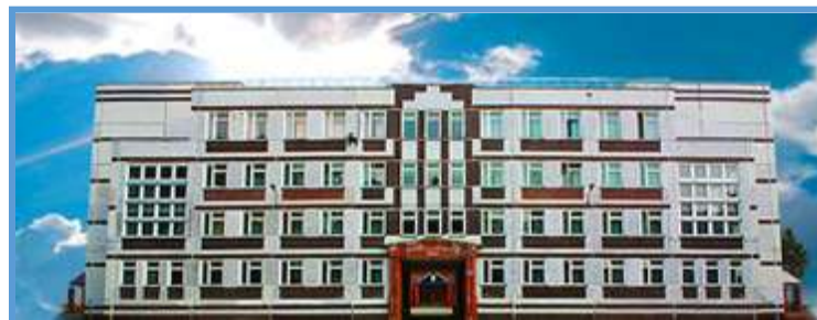
МБОУ «Северская гимназия»