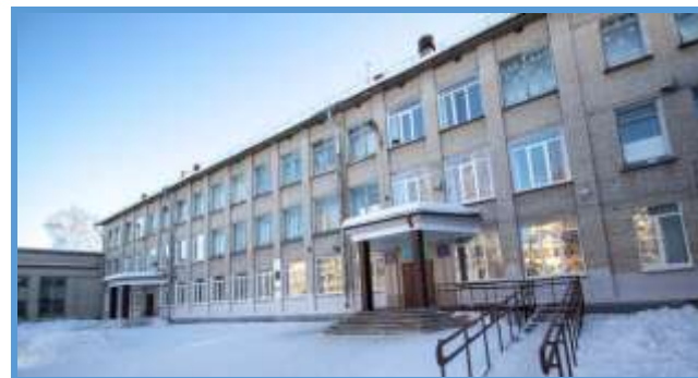
МБОУ «СОШ № 196»