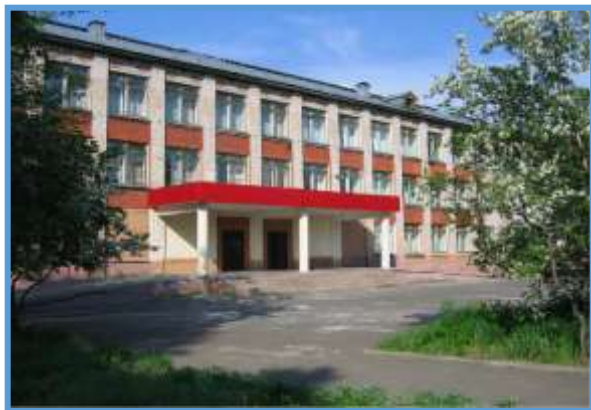
МБОУ «СОШ № 84»